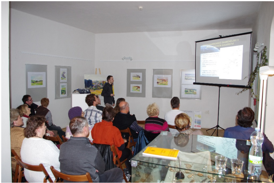
Obr. 4.: Fotografie z konání přednášky pro veřejnost dne 23. 10. 2014