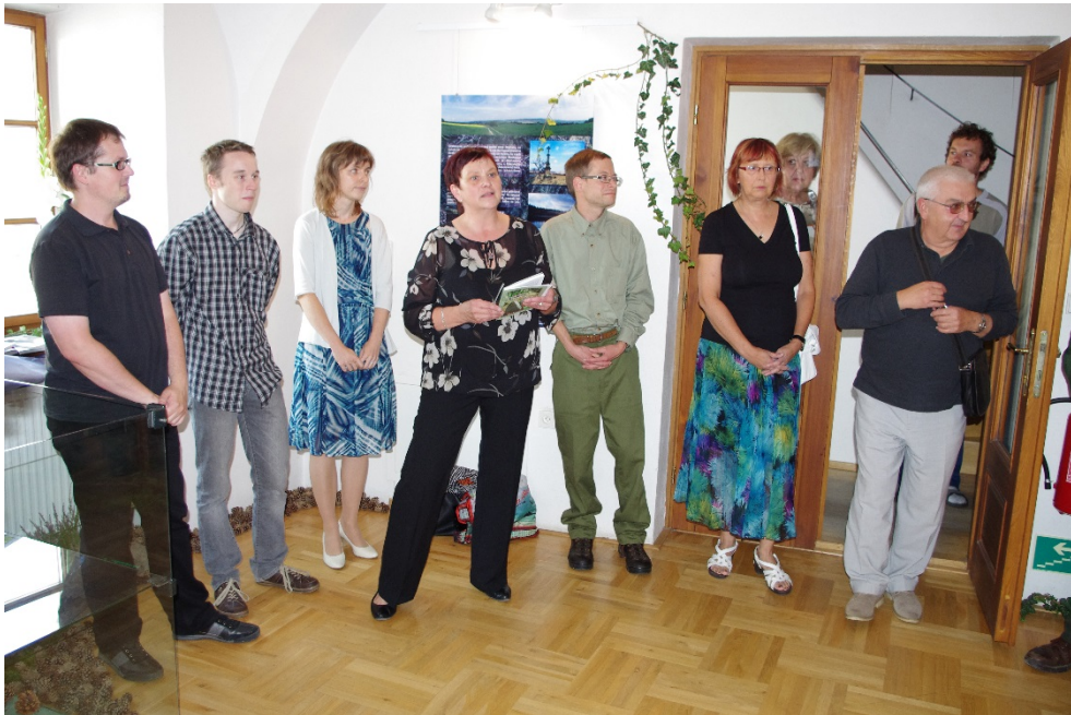
Obr. 3.: Fotografie expoziční a autorských kolektivů při vernisaži 4. 9. 2014.